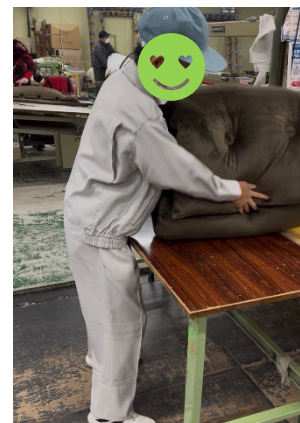
ロングクッションの製造

ネクストが実施している、 進路説明会 における ネクストの活動発表 、 A・B型事業所の説明 や 実習生の受け入れ などの機会をこれからもなるべく多く設け、生徒さん、保護者の方、先生方にも多くのお話を聞いていただき、「 学校→福祉的就労→一般就労 」の流れの浸透を目指していきたいと考えています。