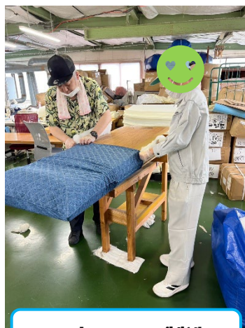
マットレスの製造

社会人となり、いきなり接客や想像できるイレギュラーな作業内容に不安を持たれたようです。そこでまずは福祉的就労を経験し、作業的にも社会人としてのスキルに関しても訓練したほうが良いとの判断でネクストを選びました。お受けしたネクストとしても精一杯支援し、近い将来に一般企業に送り出さなければと身の引き締まる思いです。